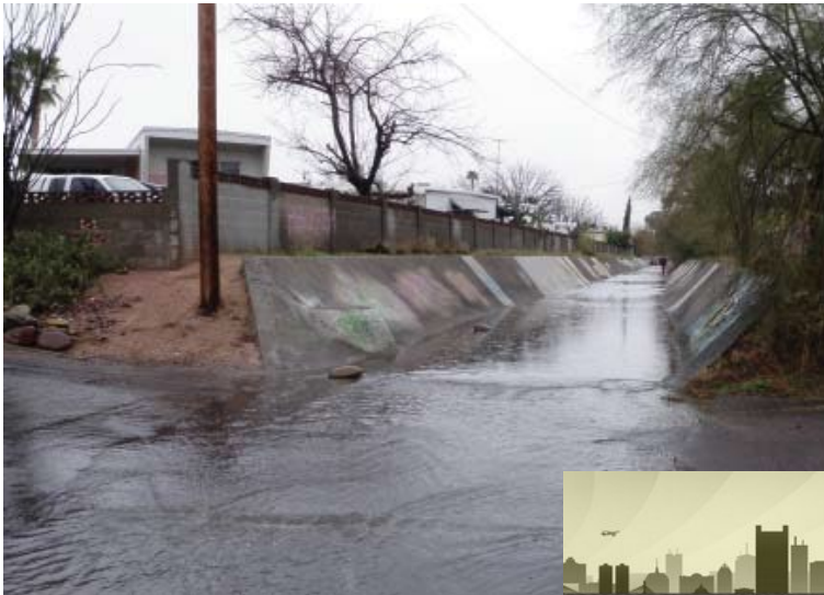
Canales de hormigón

Los comentarios deben enviarse antes del 10 de noviembre de 2022 para que el equipo del proyecto considere sus ideas a medida que desarrollamos alternativas para gestionar el riesgo de inundación en el área central. Gracias por su participación en el proceso de estudio.