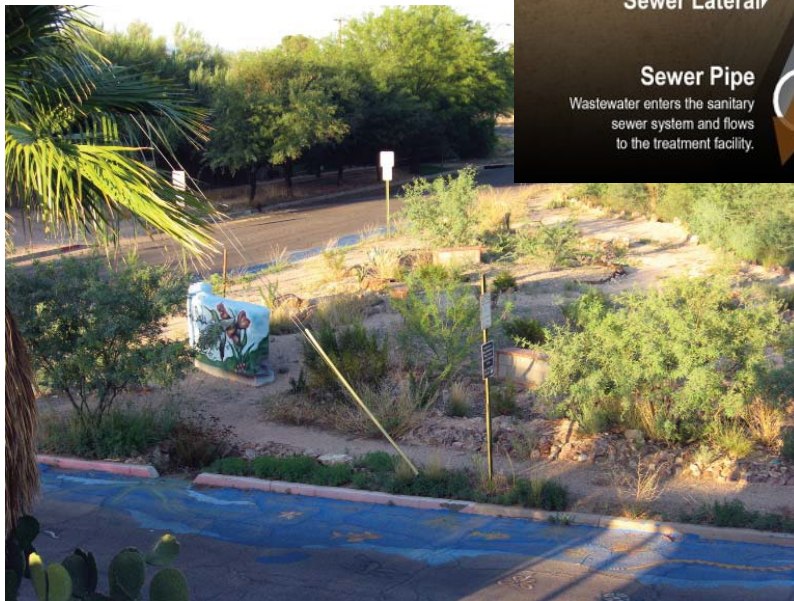
Conductos que transportan aguas pluviales

Jardín de lluvia con corte de bordillo que permite que el agua fluya